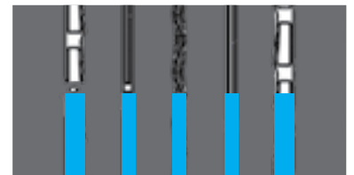
SCHEMA DE RECREUSAGE

Recreusable et rechapable en MICHELIN Remix sur l'essieu moteur.